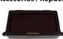
Repuesto unidad abatible