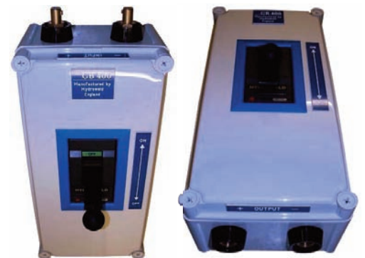
Exterior, dimensiones incl. interruptor 410 x 190 x 210 mm