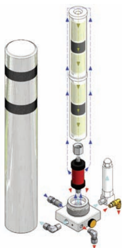
Filtro Combinado de Aire Respirable Ø 80x535