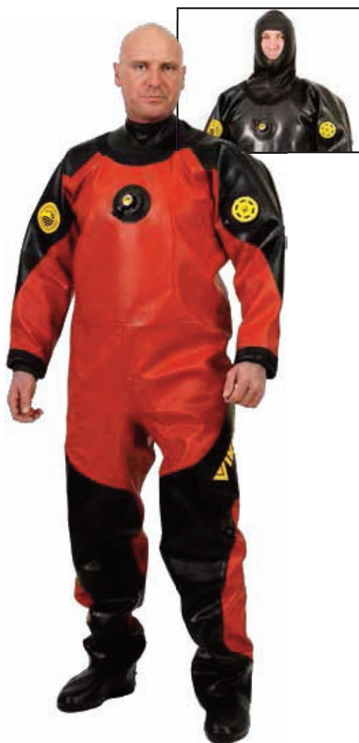
Viking PRO con cuello de látex (en el recuadro posterior se muestra el Viking PRO negro con capucha Surveyor).

El Viking PRO es el traje de Ansell Protective Solutions más vendido en todo el mundo. Diseñado para ofrecer flexibilidad y comodidad para una amplia variedad de trabajos. Las costuras vulcanizadas ofrecen una gran tranquilidad al buzo bajo el agua en cualquier situación.