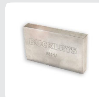
Bloque de Zinc para test 6004-0052