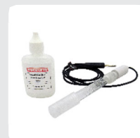
Célula Referencia Cristal 6004-0013