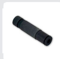
Célula Referencia K-SAT 6004-0111