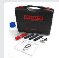
UCP1A/UCP1B Kit Calibración 6004-0032