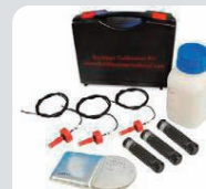
Kit Calibración BCM 6004-0031