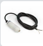
Sonda de Contacto UCP1A 6004-0039