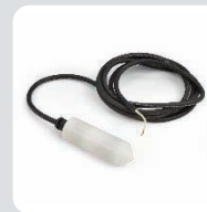
Sonda Proximidad UCP1B 6004-0043