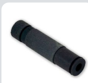
Célula referencia K-SAT 6004-0005