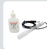
Células K-Series Cristal 6004-0013